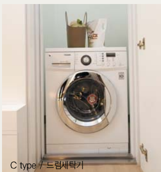
C type / 드럼세탁기