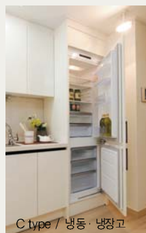
C type / 냉동·냉장고