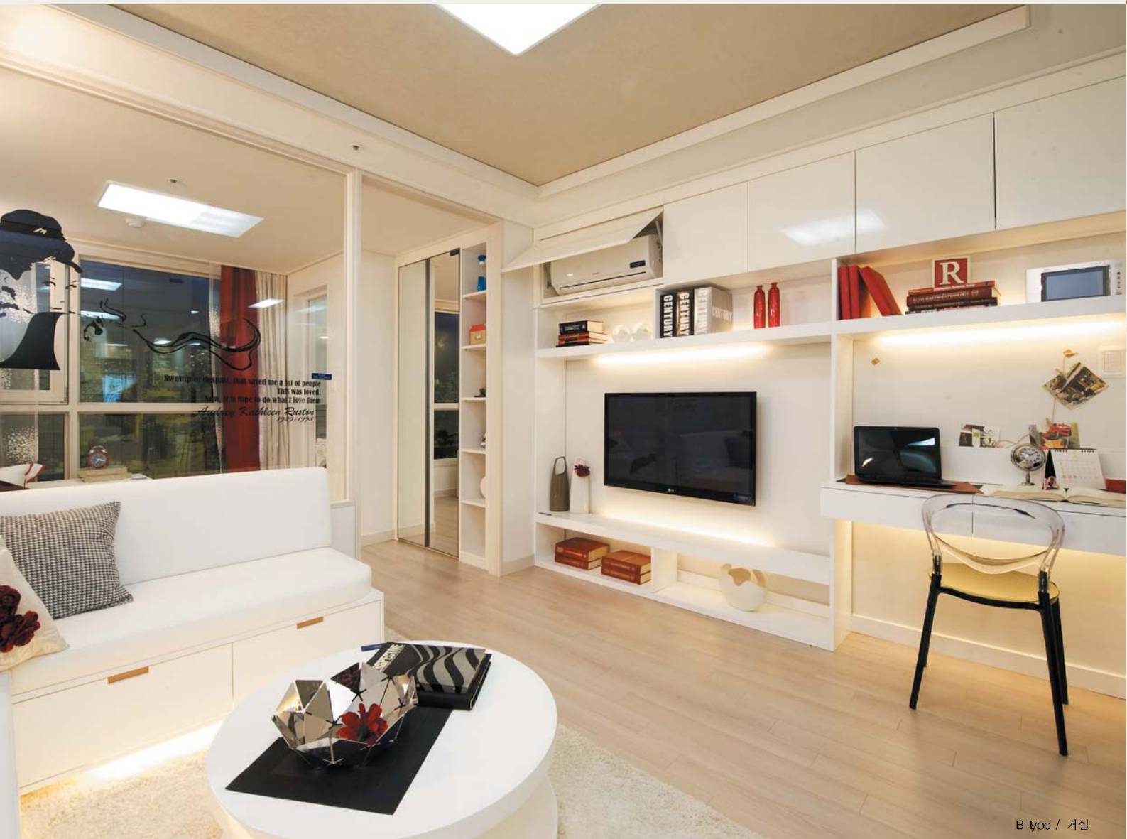
B type / 거실