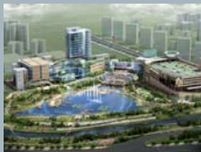
광주 수원 호수공원