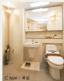
C type / 욕실