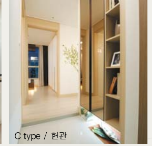
C type / 현관