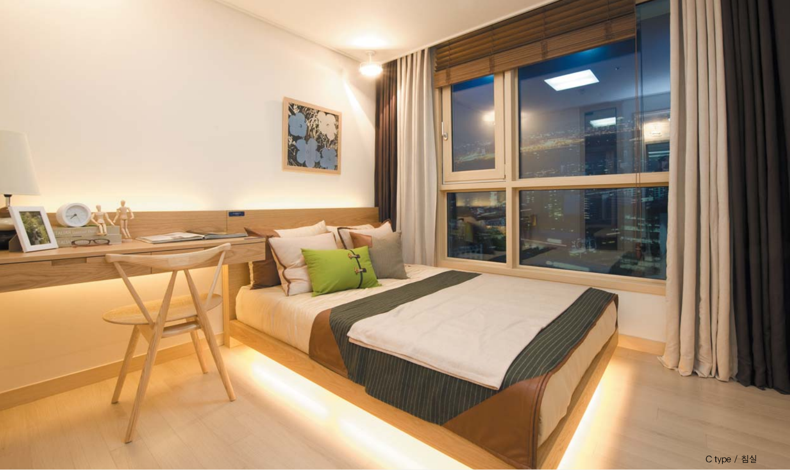
C type / 침실