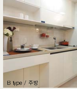
B type / 주방