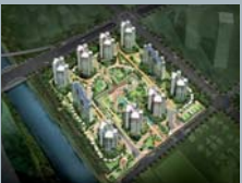
청라지구 힐데스하임 6차